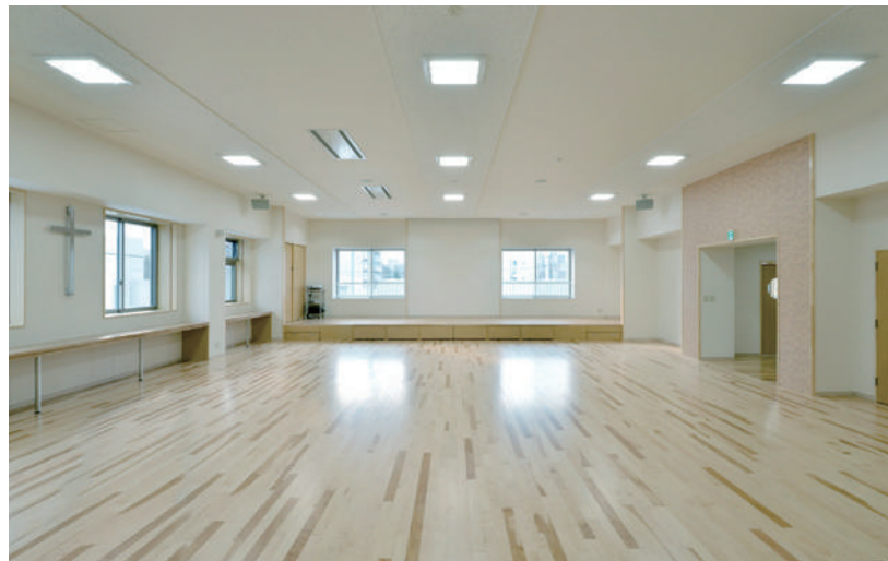
上 | 園全体の様子を感じられる職員室前の空間 下 | 自発的・主体的な遊びを誘う遊戯室