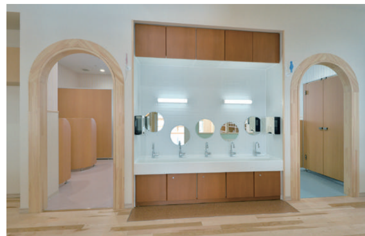
木目デザインでやさしい印象のトイレ