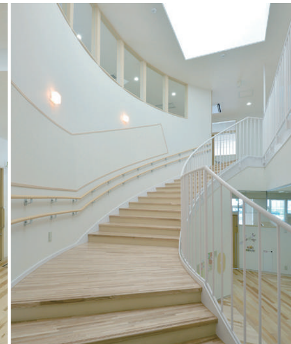
緩やかな曲面デザインの階段