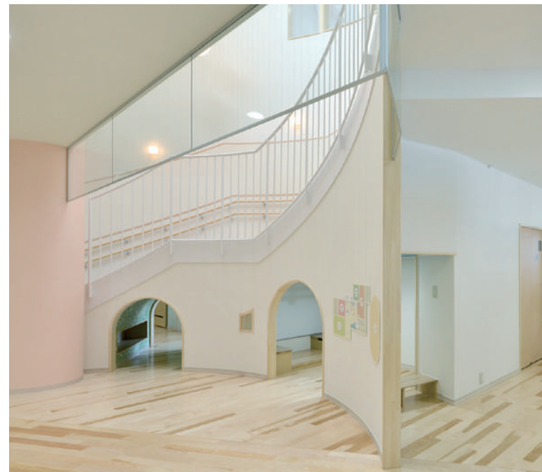
子どもたちの好奇心を刺激するトンネル