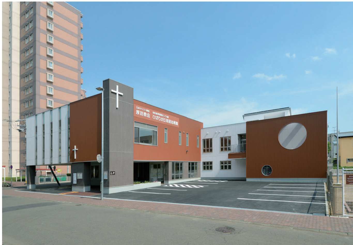
白色と茶色でリズムをつけた外観